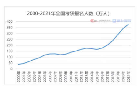
图 1 2000-2021 全国考研报名人数