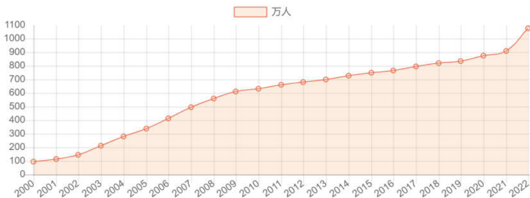
图 2 2000-2022 高校毕业生人数变化图